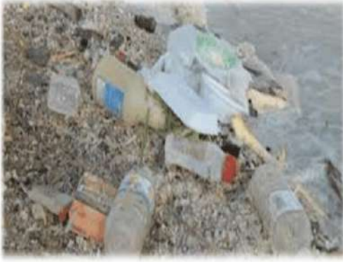
الصورة التي تُزعجني