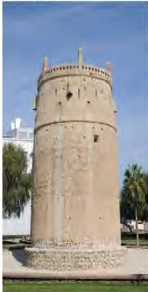
برج نهار - دبي