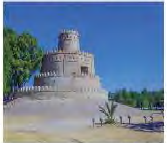
قلعة الجاهلي - العين