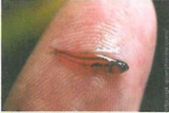
سَمَكَةُ الْجُوبَى الْقَزَمِ

الدَّيْنَابُورَاتِ، وَأَنَّ لَهَا أَنْوَاعًا كَثِيرَةً، وَخَصَائِصَ تُمَيِّزُهَا عَنِ غَيْرِهَا مِنَ الْكَائِنَاتِ الْحَيَّةِ؟!