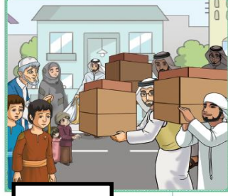
التعاون في مساعدة...

• لاحظ الصور التية واكمل : صور التعاون .