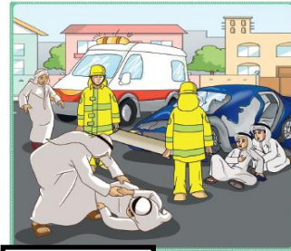
التعاون في مساعدة