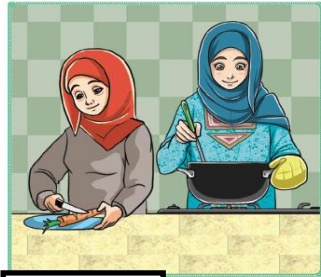
التعاون مع العاملة في