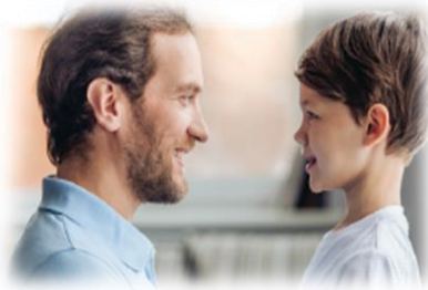
لا أخرج من المنزل بدون أنن أبي