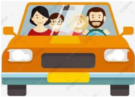
الحذر والانتباه أثناء القيادة