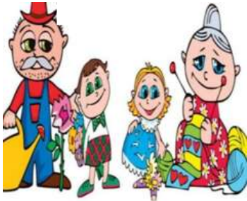
أجلس مع جدي وجدتي