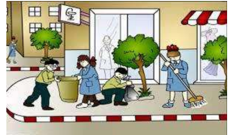
نظافة مدينتي مسؤوليتنا جميعاً