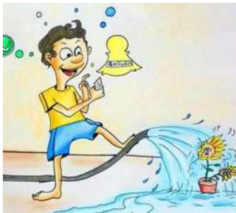
لا أسرف في استخدام المياه