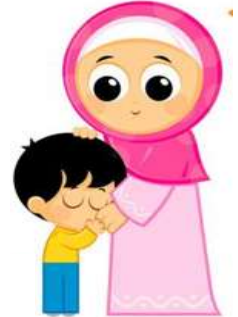
طاعة الوالدين واجبة