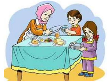
أساعد أمي وأبي