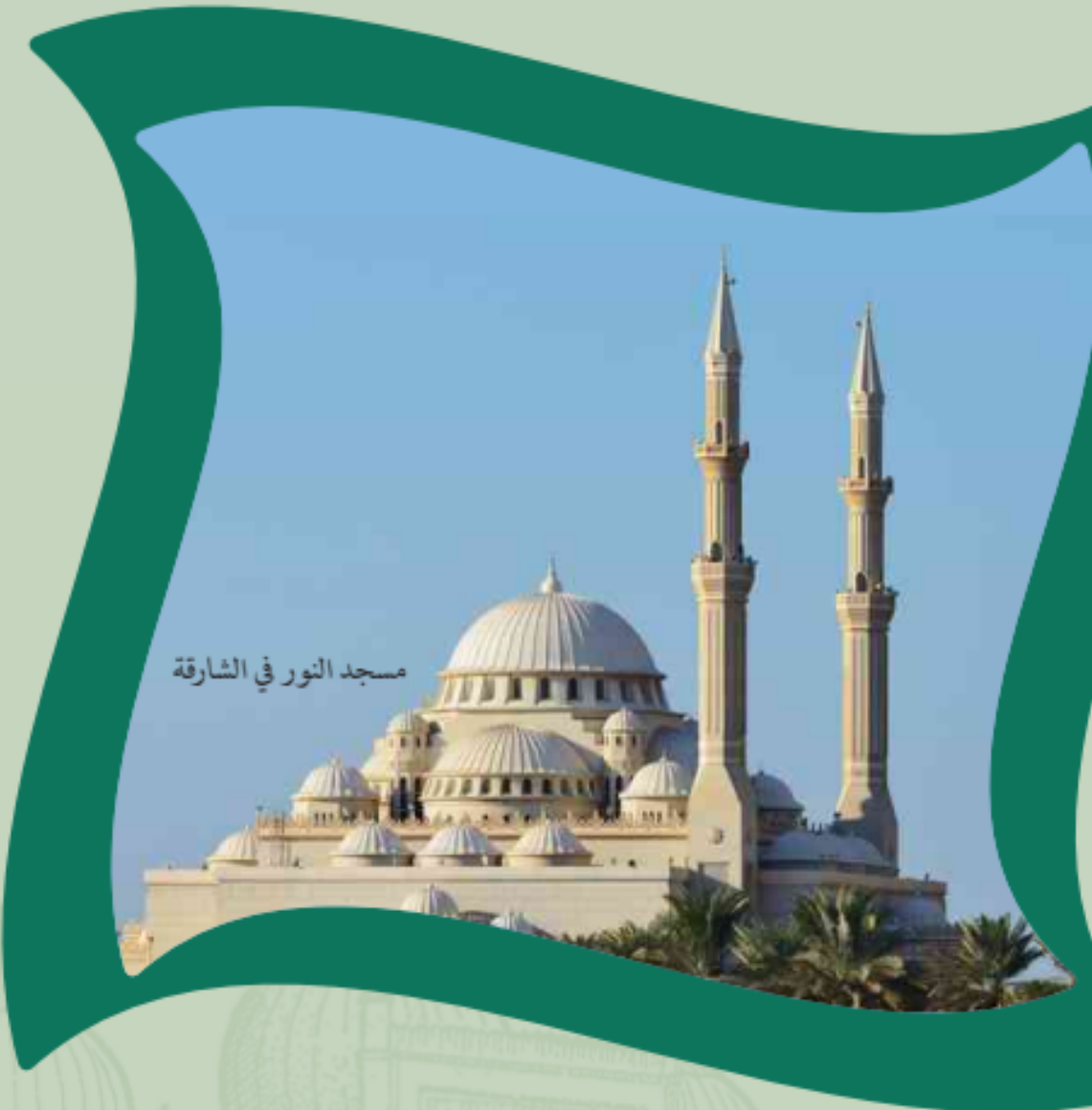
مسجد النور في الشارقة