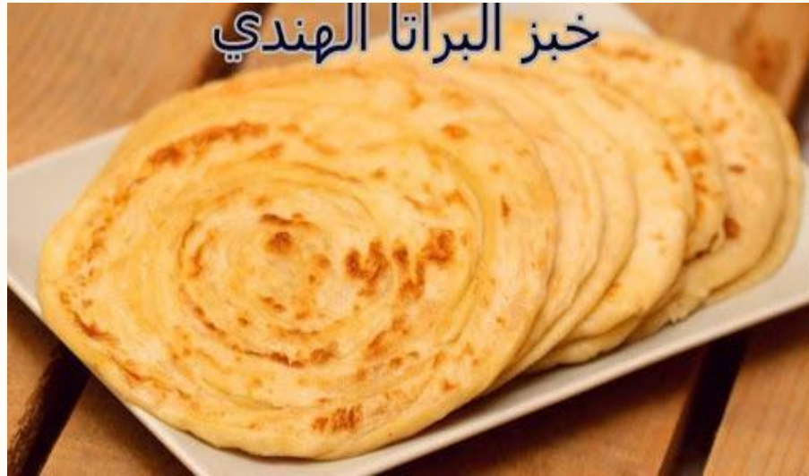
خبز البراتا الهندي

نَوْعٌ مِنَ الْمَخْبُوزَاتِ الَّتِي عُرِفَتْ فِي شِبْهِ الْقَارَّةِ الْهِنْدِيَّةِ، ثُمَّ انْتَشَرَتْ فِي دَوْلِ الْخَلِيجِ الْعَرَبِيِّ، تُصَنَعُ الْبَرَاثَا مِنْ طَحِينِ الْقَمَحِ الْكَامِلِ، وَتُقَلَى فِي السَّمْنِ أَوْ الزَّيْتِ، وَتُلَفُّ عَلَى شَكْلِ شَطِيرَةٍ؛ لَيْسَهُلَّ تَنَاوُلُهَا.