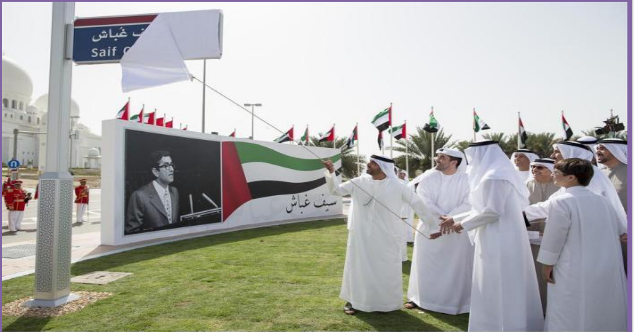
إطلاق اسم الفقيه سيف غباش على أحد شوارع أبوظبي