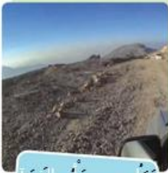
جَبَلِ جَيْسٍ - رَأْسِ الْخَيْمَةِ