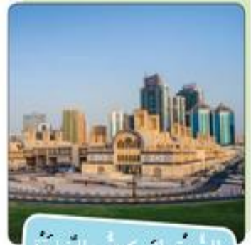
السُّوقِ الْمَرْكَزِيِّ - الشَّارِقَةِ

جَبَلِ جَيْسٍ؛ أَعْلَى جَبَلٍ فِي دَوْلَةِ الْإِمَارَاتِ الْعَرَبِيَّةِ الْمُتَّحِدَةِ، وَتُعْطِطُهُ الشُّلُوجُ فِي فَصْلِ الشِّتَاءِ أَحْيَانًا.