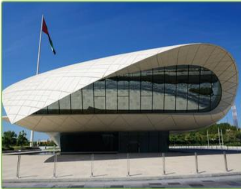
مُتْحَفِ دَارِ الأُتْحَادِ

وَصَحَّ لَنَا مَسْؤُولُ المُتْحَفِ أَهْمِيَّةَ مَوْقِعِ دَوْلَةِ الإِمَارَاتِ العَرَبِيَّةِ المُتَّحِدَةِ.