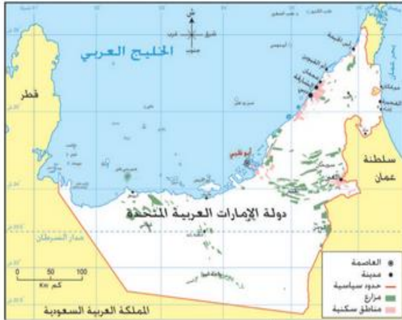
دَوْلَةُ الْإِمَارَاتِ الْعَرَبِيَّةِ الْمُتَّحِدَةِ

يَدُ الْعَوْنِ كَعْنَى طَلَبِ الْمُسَاعَدَةِ، وَالرُّؤْدُ يَكُونُ «فَالِكُ طَيِّبٌ».