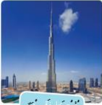
بُرْجِ خَلِيفَةَ - دُبَيِّ