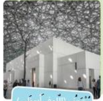
مُتْحَفُ (اللُّوفِرِ أَبُو ظَبْيِ)