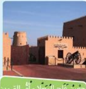
حِصْنُ قَلْعِ الْمُعَلَّا - أَمْرِ الْقِيَوِينِ