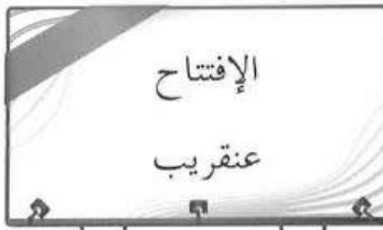
الإفتتاح عن قريب

2. اكتشف الأخطاء في الإعلانات الآتية، ثم أعد كتابتها صحيحةً: