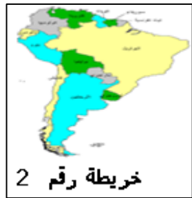
خريطة رقم 2