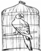
صورة رقم 2