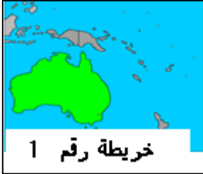
خريطة رقم 1

وقد تبقى صغار ببغاوات "الماكو" الكبيرة الحجم من 3 - 4 شهور في العش.